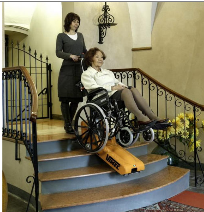
SCHODOŁAZ GĄSIENICOWY VIMEC T09

Jeśli masz dodatkowe pytania? Zapraszamy do kontaktu!