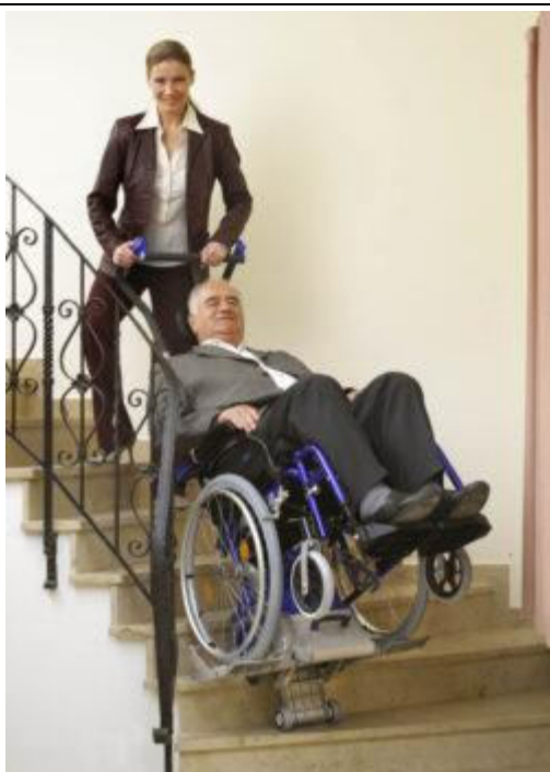
SCHODOŁAZ KROCZĄCY LIFTKAR UNI