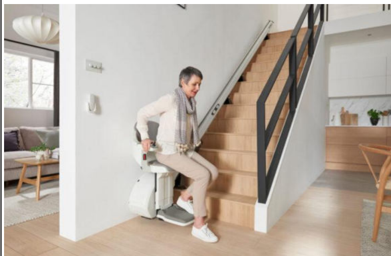
Krzeselko na szynie prostej HOMEGLIDE